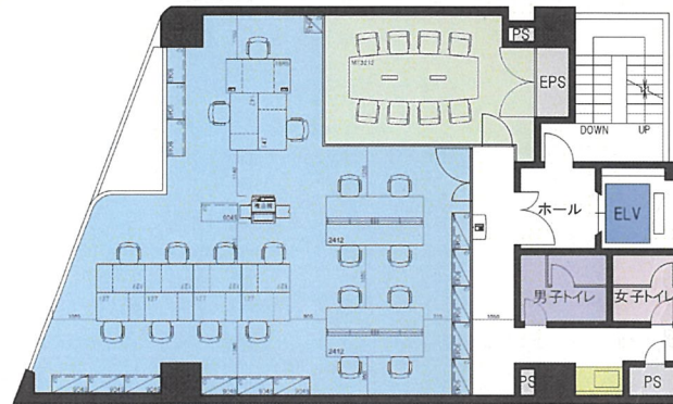
レイアウト図面(参考)